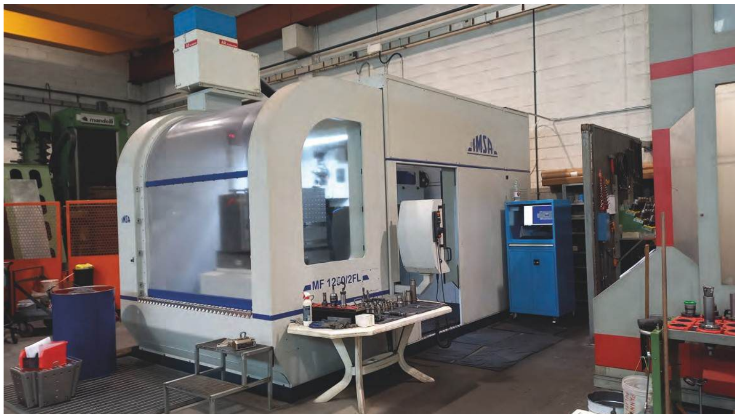
Machine de forage profond et fraisage IMSA MF1250/2FL présente dans l'atelier