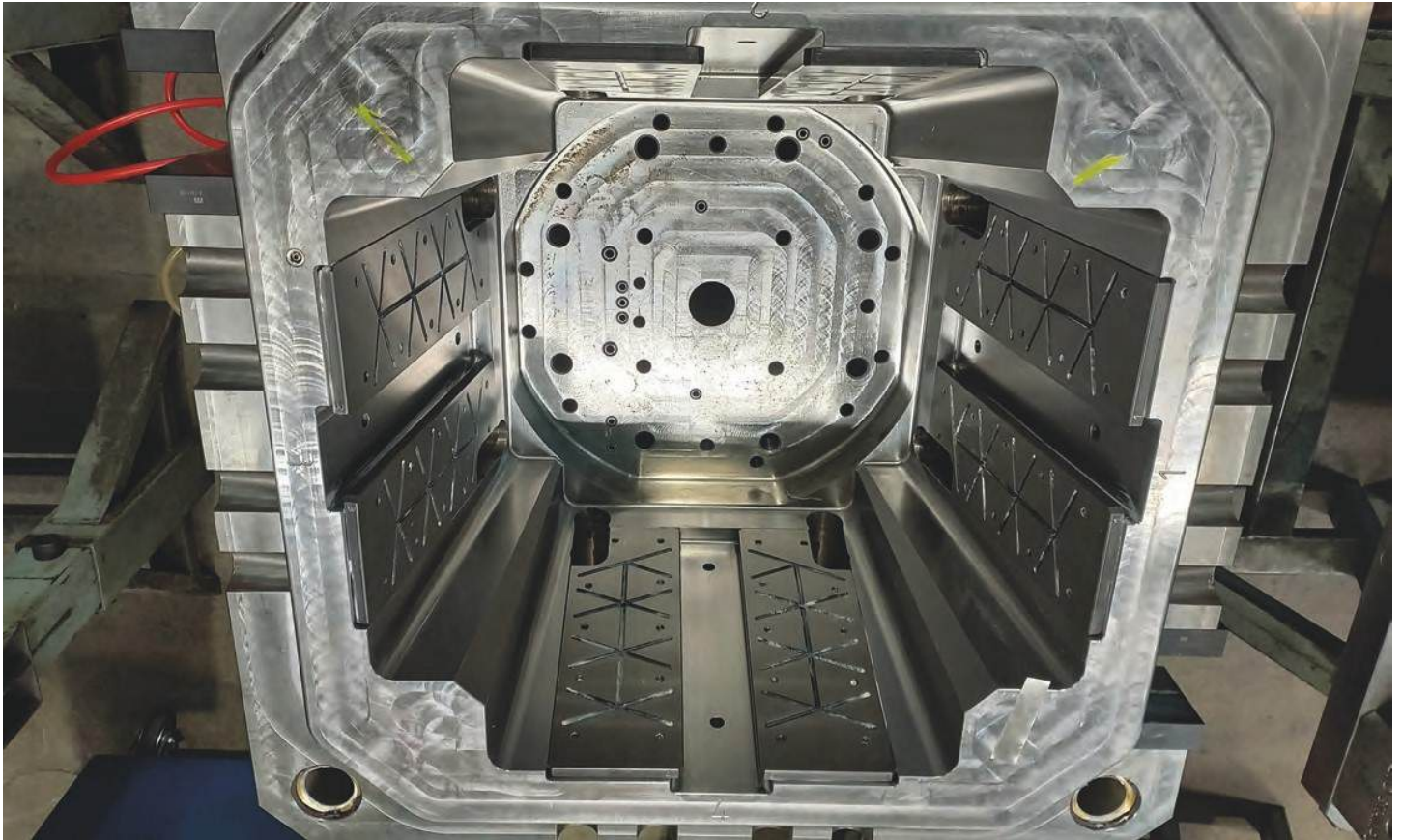
Outillage réalisé par O.M.C. Stampi

compensation automatique de la distance entre les deux broches lors de la commutation forage /fraisage.