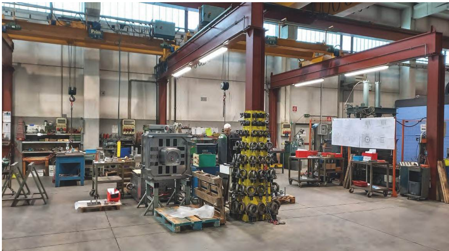
Le département d'assemblage se compose de trois stations, chacune desservie par son propre pont roulant, de manière à travailler de manière autonome et indépendante

être forés en une seule fois en utilisant toute la course verticale de la machine.