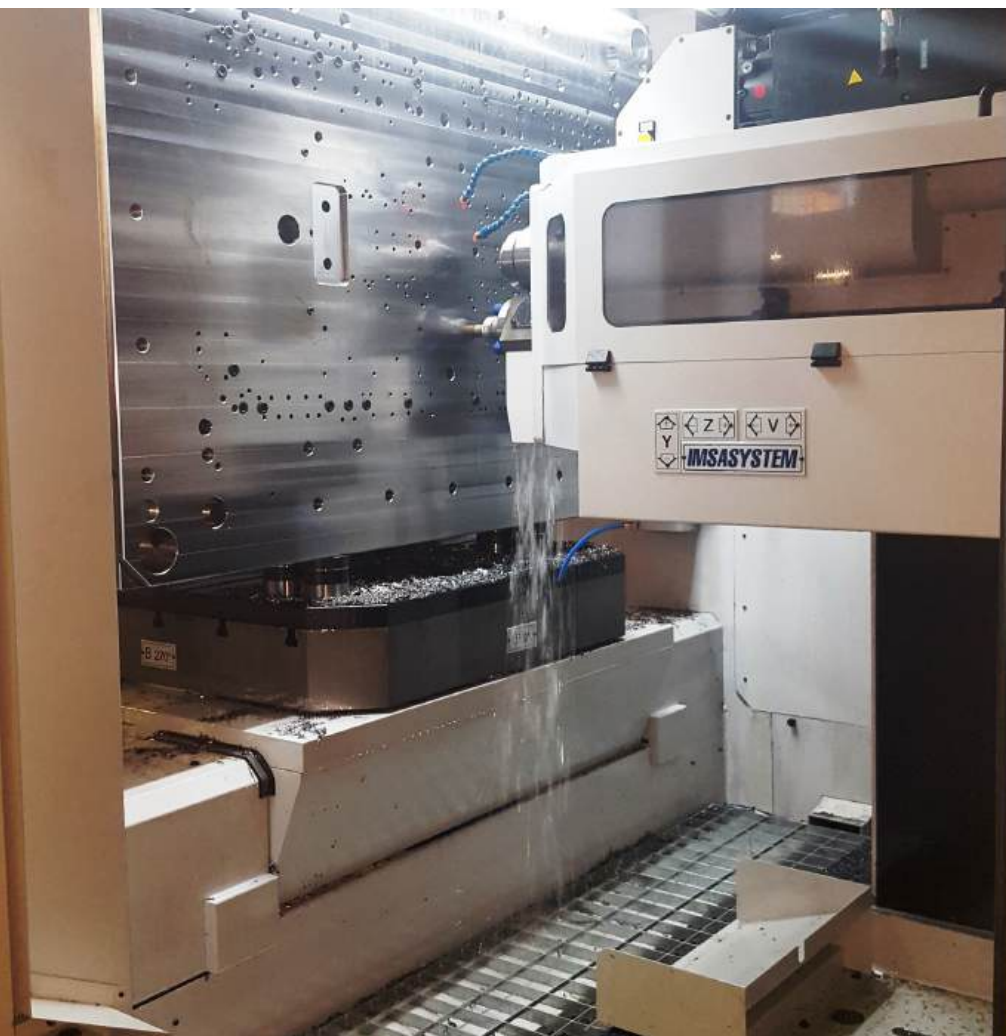
Forage profond sur la foreuse/fraiseuse MF1250/2FL

constamment mis à jour et renouvelé, tout comme les applications utilisées, afin de toujours atteindre la qualité et la précision requises. Les technologies de pointe, l'industrie 4.0, l'interconnexion et le grand professionnalisme sont d'autres pièces du puzzle qui permettent d'obtenir un excellent résultat final », déclare Silvio Pesenti. « Toutes les fraiseuses les plus récentes et le centre de forage profond sont connectés au système de gestion WorkPLAN afin de gérer l'ensemble du processus de production, du devis à la fabrication des moules ».